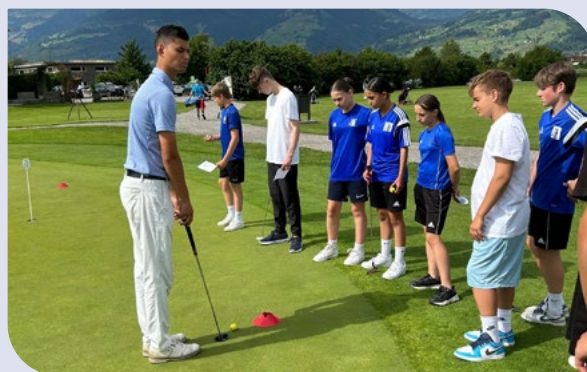
Golfen am Sporttag 2023.