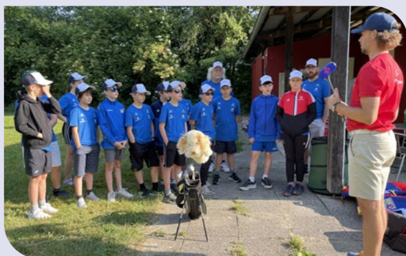
Der Golfverband präsentiert sich beim Olympic Day.

Es ist essenziell, dass strategische Massnahmen klare Ziele definieren, den aktuellen Zustand erfassen und die Veränderungen regelmässig gemessen werden. Die European Golf Association (EGA) analysiert die Daten aller europäischen Verbände und veröffentlicht alle zwei Jahre einen Bericht, der Vergleichswerte zu den anderen nationalen Golfverbänden bietet. Vor der Umsetzung der strategischen Massnahmen im Jahre 2021 hatte der GVL einen Jugendanteil von 6.0 %, ähnlich wie unsere Schweizer und österreichischen Nachbarn. Der europäische Durchschnitt lag aber bei 7.5 %. Der GVL setzte sich das Ziel, innerhalb von drei Jahren einen Jugendanteil von 8 % zu erreichen.