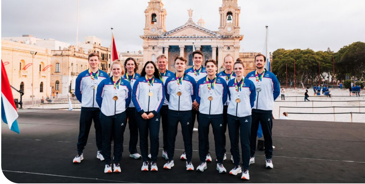
Die Medaillengewinner*innen der GSSE Malta 2023.